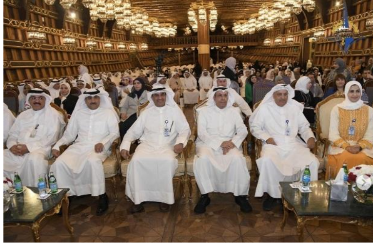
المؤتمر الدولي الأول للتربية العملية – التنمية التعليمية المستدامة في ظل رؤية الكويت 2030

وتتعاون الهيئة بشكل وثيق مع الأمانة العامة للمجلس الأعلى للتخطيط والتنمية (SCPD) ومؤسسة الكويت للتقدم العلمي (KFAS) وعدد من الجهات الوطنية الأخرى لتوحيد الجهود الرامية إلى تحقيق التكامل بين التعليم والاقتصاد والتنمية المستدامة.