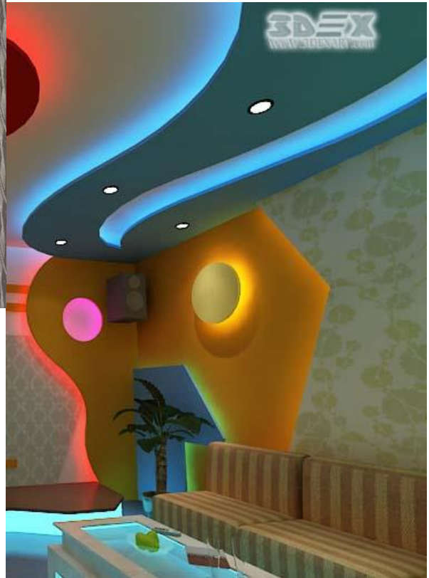
Interior design for kids' room