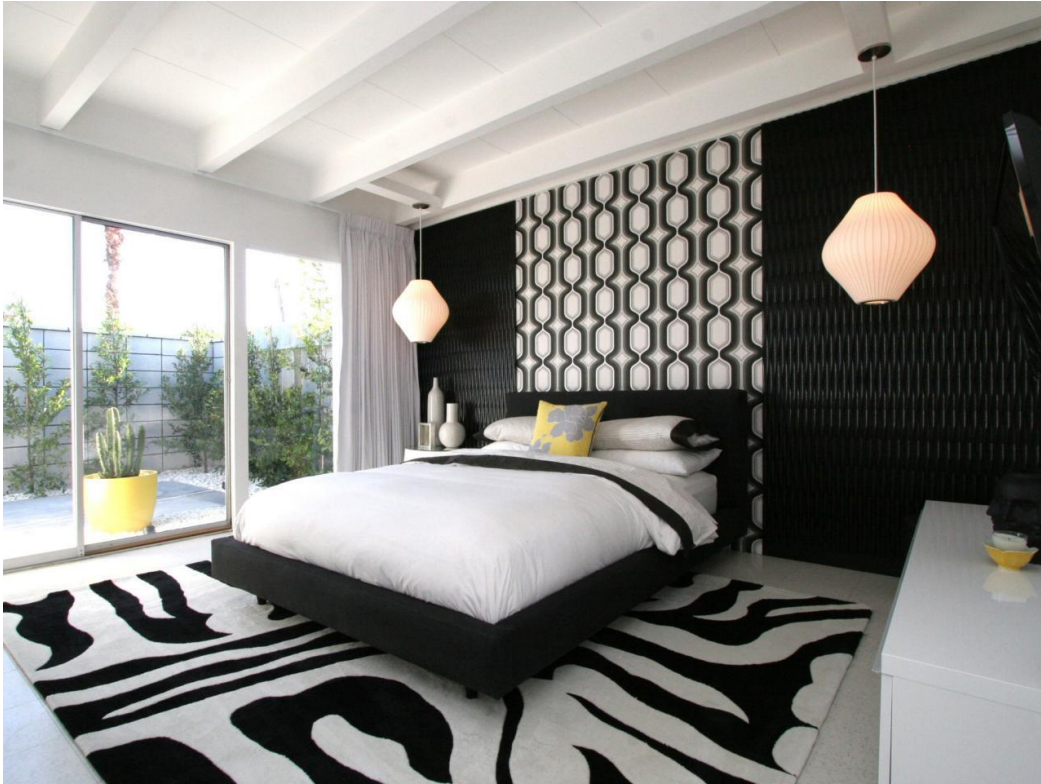
Bedroom lighting design