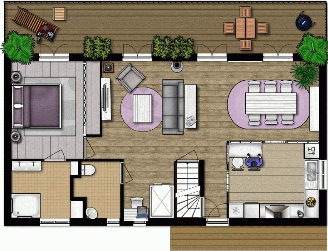
Space planning for interior house

يندر استعماله فى ترتيب حجات البيت بينما تستعمل هذه الطريقة فى ترتيب أثاث حجات الفنادق الكبرى أو المعارض .